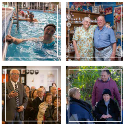
Tabla 2. Ámbitos seleccionados sobre políticas públicas en personas mayores

Fuente: Servicio Nacional del Adulto Mayor (2013).